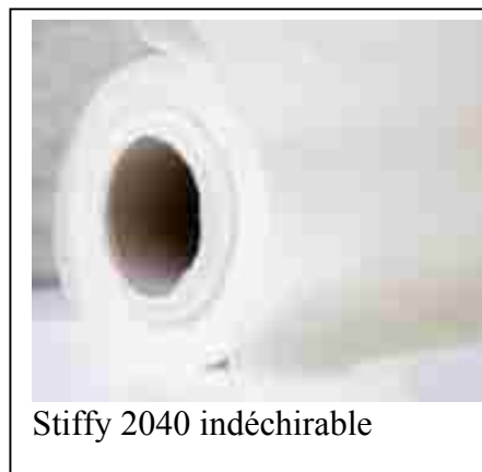
Stiffy 2040 indéchirable

STIFFY 2040 indéchirable spécialement conçu pour les tissus très délicats ou pour les motifs à forte densité de points. Sa texture procure un effet peau de pêche. Sa rigidité dans le sens de la chaîne et de la trame lui offre une grande polyvalence sur une multitude de produits. Non tissé à découper