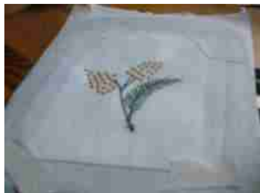
Photo 7 envers de la broderie