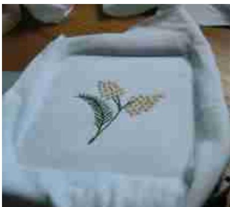
photo 6 endroit de la broderie